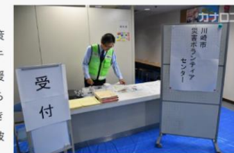
開設した災害ボランティアセンターの受付＝川崎市中原区

台風19号による深刻な被害を受け、川崎市は被災者向けにさまざまな支援策を打ち出した。16日には災害ボランティアセンターを中原区内に開設し、支援する側とされる側をつなぐ。17日からは、罹災(りさい)証明書の発行手続きを自宅で済ませられるよう、市職員が被災地域を戸別訪問する取り組みを進める。