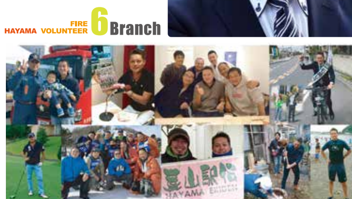
●発行元：石岡じっせい 葉山町長柄350-2-メゾン葉山202